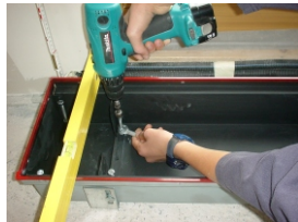
6. Wanne einjustieren