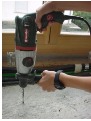
2. Bohrung in Rohbeton

1. Markieren der Wannenbefestigung am am Rohbetonboden.