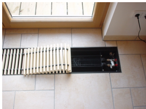
10. Estrich und Fertigfußboden verlegen, Konvektorrost einlegen - fertig!