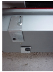
4. Schalldämm-puffer auf-stecken