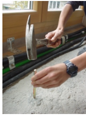
3. Schlagdübel setzen