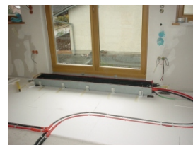
9. Isolation u. Trittschalldämmung verlegen