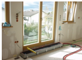
8. Evtl. Wannenhöhe nachjustieren