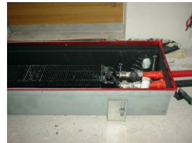
7. Konvektor wasser-seitig anschliessen